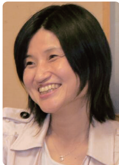
社会福祉法人豊中市社会福祉協議会